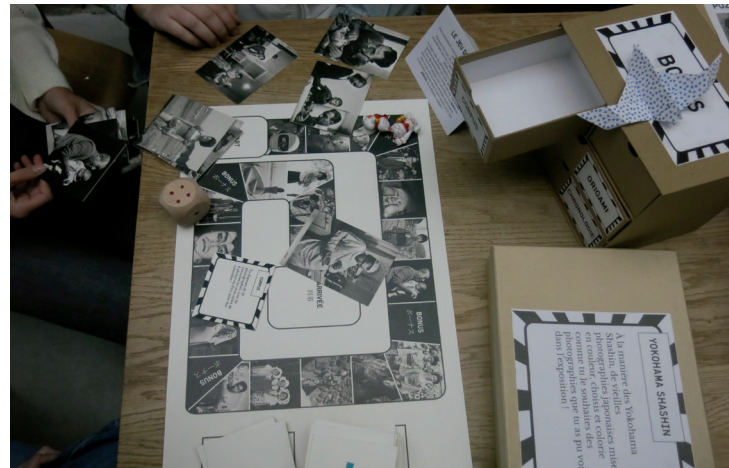
Jeu de l'oie créé pour l'exposition d'Issei Suda, 2024