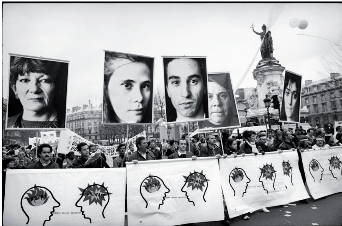
Ne pas plier, 1990.

Le Centre d'art GwinZegal présente pour la première fois en France, une exposition d'envergure de la photographie néerlandaise Bertien van Manen (1935-2024). Un temps photographe de mode, c'est en feuilletant Les Américains , le livre de Robert Frank, que Bertien van Manen aura le déclic de la photographie qu'elle veut réellement faire et du monde qu'elle souhaite raconter. Elle ne cherche plus à illustrer le monde, mais à le vivre en étant au plus proche des êtres et des communautés qui la passionnent. Elle part en 1985 dans les Appalaches à la recherche de femmes mineurs dans le Tennessee et le Kentucky. On peut y suivre sur plusieurs générations la vie quotidienne