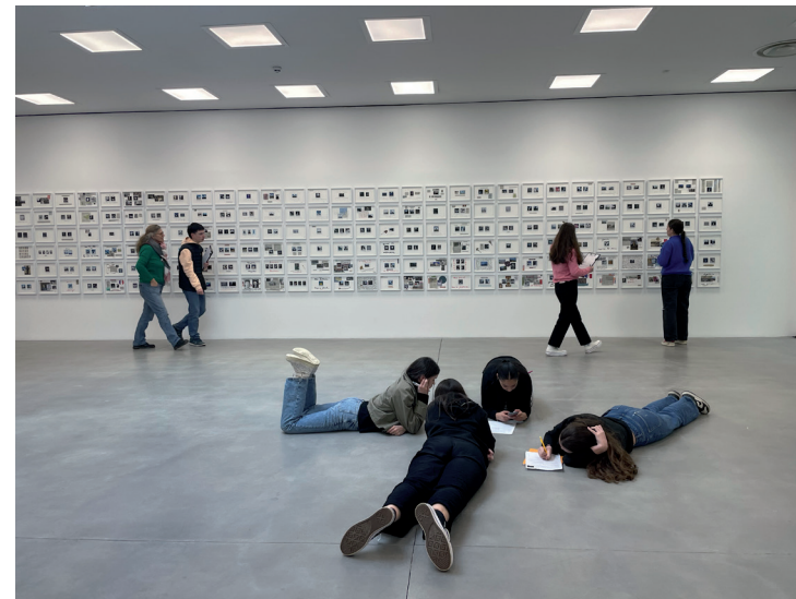
Visite de l'exposition de Daniel Blaufuks par une classe de Terminale, 2024.

Basée sur l'échange avec les élèves, la visite se déroule sous la forme d'une discussion autour des œuvres. La visite peut se faire en français ou en anglais.