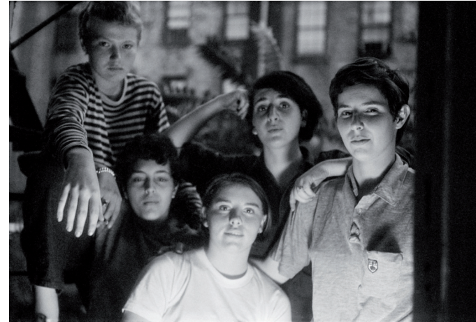
Oak, Robin, Binky, Chris et moi, Bébés Gouines, E. 9th Street, New York, 1969.

En coproduction avec le Centre de la photographie de Mougins.